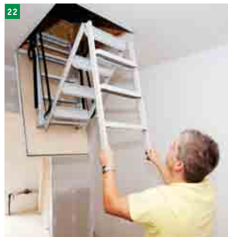
22 schody zasuneme do víka