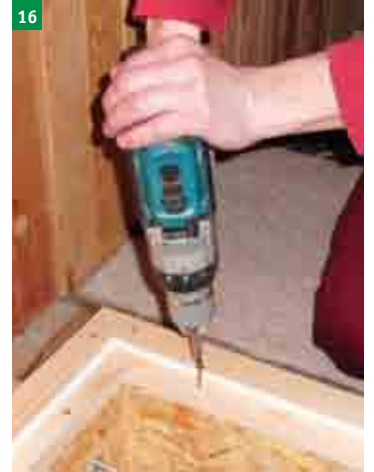
16 spojení OSB rámu s dřevěným rámem