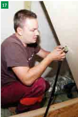
17 spojení táhel otvírání s horním víkem