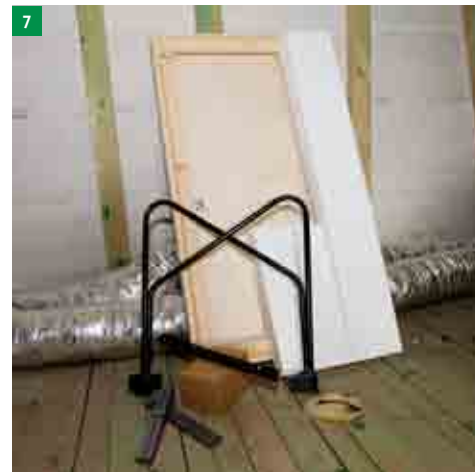
7 přemístění montážních dílů do patra