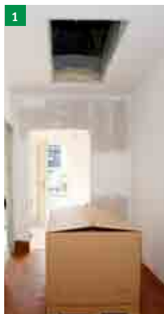
1 dodaný výrobek

1 поставленное изделие 2 распаковка складной лестницы «ARISTO» 3 снятие верхнего люка 4 проверка комплектности поставки 5 установка стропильных проушин 6 крепление подъемного оборудования – грузоподъемность 150 кг (не является составной частью поставки) 7 перемещение монтажных деталей на этаж 8 установка фиксирующих болтов в плоские крепления 9 один человек на верхнем этаже при помощи подъемного оборудования подымет лестницу в отверстие, второй человек их снизу придерживает, направляет в отверстие и контролирует усадку в отверстии 10 демонтаж фиксирующих болтов из креплений 11 монтаж швеллеров 12 демонтаж стропильных проушин и заглушка возникших отверстий заглушками 13 запенивание щели между лестницей и строительным проемом монтажной противопожарной пеной (пена не является составной частью поставки) 14 установка утепляющего обрамления 15 установка деревянной рамы (ВНИМАНИЕ, петли на раме должны быть расположены на противоположной стороне скобы крепления пружин) 16 соединение ОСП рамы с деревянной рамой 17 соединение тяг открытия с верхним люком 18 монтаж верхних перил 19 регулировка открывания нижнего люка при помощи регулировочных болтов (верхняя плоскость настила должна быть параллельна с полом) 20 регулировка на высоту при помощи ножек 21 при складывании лестницы одной рукой придерживаем люк, а второй рукой складываем лестницу 22 лестницы задвинем в люк 23 вторая сторона опускающей штанги оборудована пластиковым наконечником, которым люк закрывается