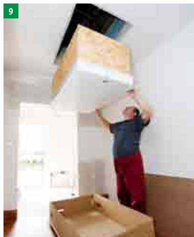
9 jedna osoba v horním podlaží pomocí zvedacího zařízení schody vyzvedne do otvoru a druhá osoba je zespodu přidržuje a kontroluje dosednutí do otvoru