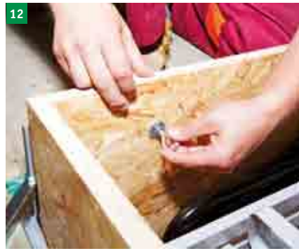
12 demontáž závěsných ok a zaslepení vzniklých otvorů záslepkami