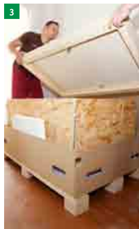
3 sundání horního víka