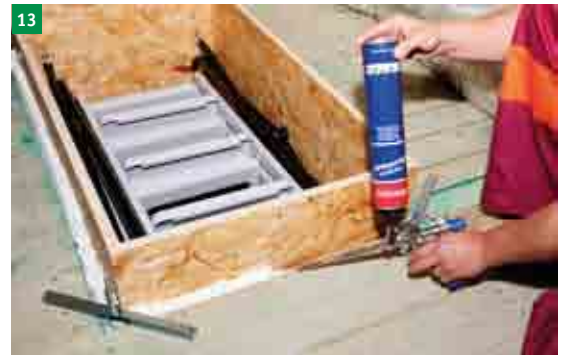
13 vypěnění mezery mezi schodištěm a stavebním otvorem montážní protipožární pěnou (pěna není součástí dodávky)