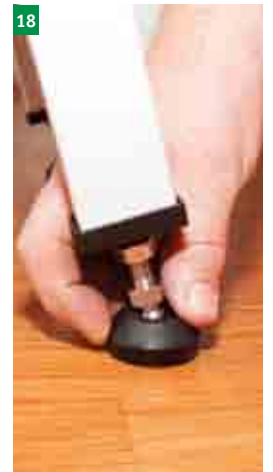
20 výšková regulace pomocí nožiček