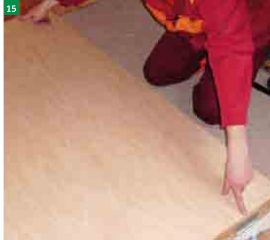
15 nasazení dřevěného rámu (POZOR panty na rámu musí být na protilehlé straně třmenu uchycení pružin)