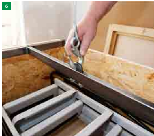
6 uchytení zvedacího zařízení – nosnost 150kg (není součástí dodávky)