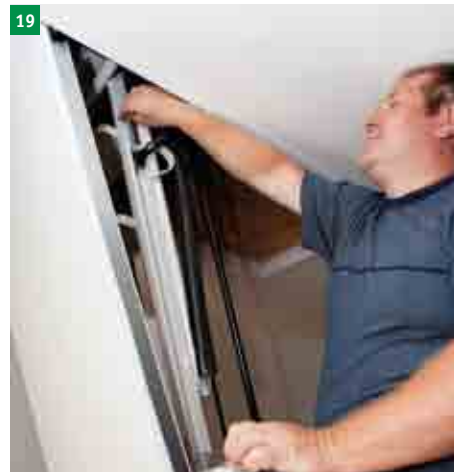
19 upravení otvírání dolního víka pomocí regulačních šroubů (horní plocha nášlapů musí být rovnoběžně s podlahou)