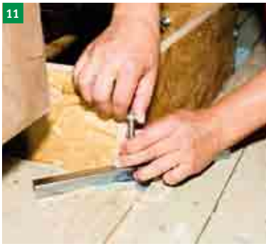
11 montáž nosníků