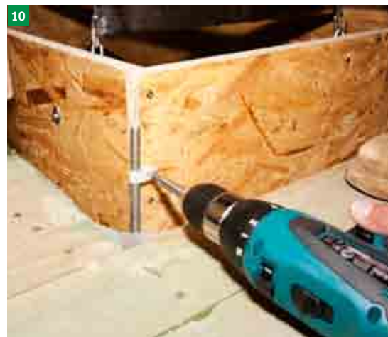
10 demontáž kotevních šroubů z úchyť