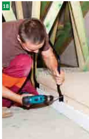
18 montáž horního zábradlí