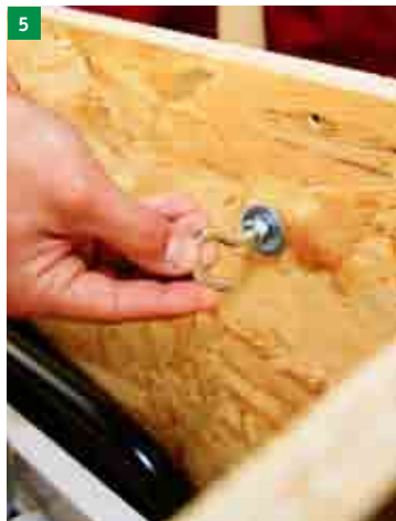
5 nasazení závěsných ok