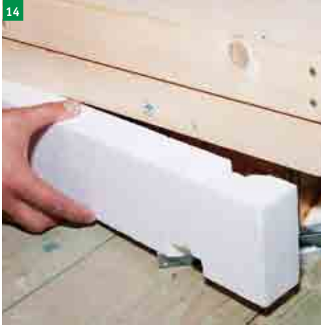
14 osazení zateplovacího límce