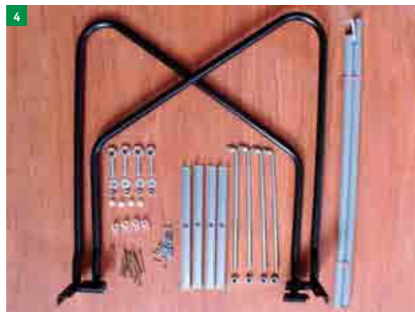
4 kontrola úplnosti dodávky