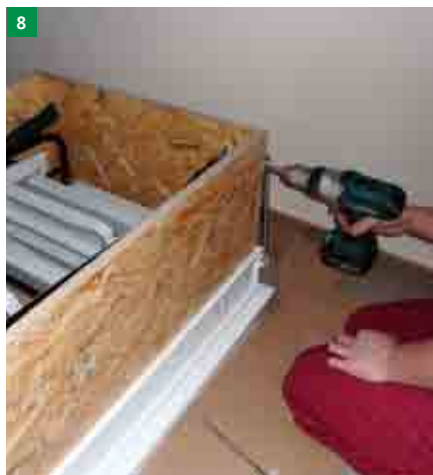
8 montáž kotevních šroubů do plastových úchyť