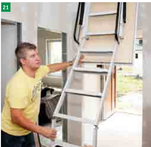
21 při skládání schodů jednou rukou přidržíme víko a druhou rukou skládáme schody