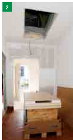
2 rozbalení stahovacích schodů ARISTO